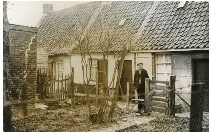
Foto: beluik op de Oostwijk in de 19e eeuw

In 1866 richtte de cholera in Harelbeke een ravage aan. Tussen 7 september en 12 december van dat jaar eiste deze ziekte in onze stad 72 slachtoffers.